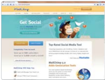
MailChimp is een populaire webbased aanbieder voor het verzenden van nieuwsbrieven.

nog een sjabloon voor je nieuwsbrief bij, in lijn met de huisstijl. Ook krijg je een training van twee uur, zodat je de fijne kneepjes van het pakket leert kennen. Het grote voordeel van MailCamp is dat het versturen van nieuwsbrieven gratis is. Je hoeft dus geen bedrag te betalen voor iedere verstuurd nieuwsbrief. Dat geldt wanneer je de software op een eigen server laat installeren. MailCamp kan de software ook op een gehoste server zetten, zodat je geen omkijken hebt naar het beheer van de server en software. Dat kost ongeveer een tientje per maand, zonder extra kosten voor het versturen van mail (binnen bepaalde (royale) grenzen). Ook daarmee is het nog steeds een voordelige aanbieder.