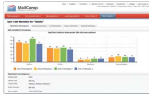
MailCamp geeft inzicht in de resultaten van de nieuwsbrief.