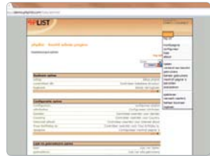
De open source software PHList voor het versturen van nieuwsbrieven kent een steile leercurve.